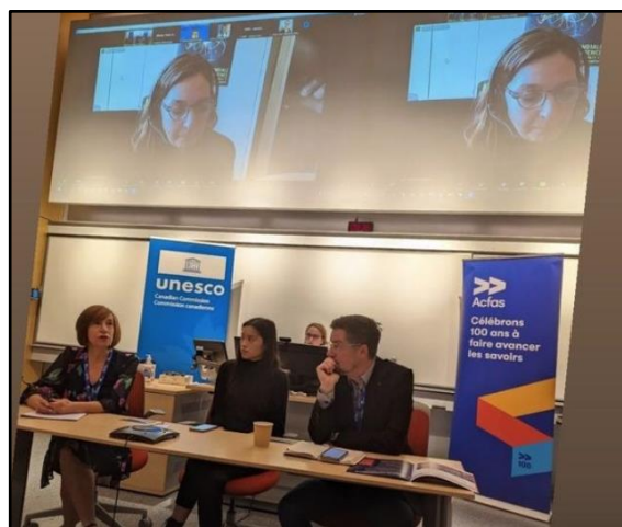
Les panélistes de l'événement.