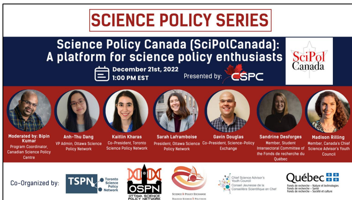
Advertisement for the launch event.