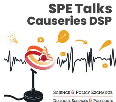
Logo du balado DSP