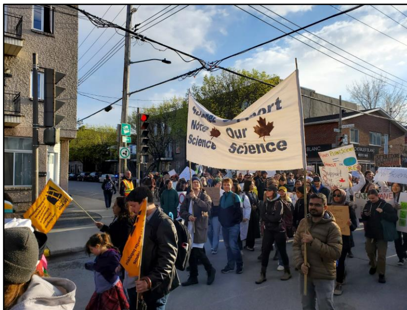
Manifestation co-organisée par DSP dans le cadre de la mobilisation nationale de Soutenez notre science le 1 er mai 2023.

DSP est un partenaire de SOS presque depuis sa fondation. Nos contributions incluent la co-organisation des manifestations de Montréal du 17 août 2022 et du 1 er mai 2023 en soutien aux revendications de SOS , la publication de deux textes sur le sujet ( un éditorial pour le Centre sur les politiques scientifiques canadiennes et un article de blog ), ainsi que la participation en tant que témoins aux travaux du Comité permanent de la science et de la recherche de la Chambre des Communes relatifs aux Programmes des bourses d'études supérieures et postdoctorales du gouvernement du Canada (voir plus haut). L'un de nos co-présidents a également siégé au Conseil exécutif de SOS d'avril à juillet 2023 pour y représenter DSP. Nous faisons partie des partenaires communautaires de SOS , aux côtés d'autres organisations de politique scientifique et de représentation de la Relève en recherche au Canada.