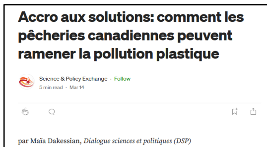
Capture d'écran d'un billet de blogue.